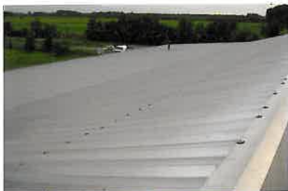
Figura 1: La realizzazione di una nuova copertura a seguito della rimozione dell'amianto.

Per capire bene, però, la portata che la sostituzione di coperture in amianto con dei pannelli fotovoltaici avrebbe nel settore