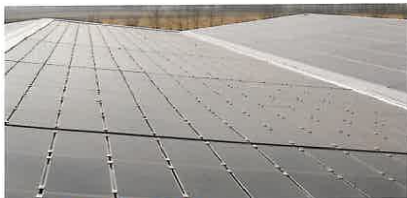
Figura 2: Particolare dell'impianto finito.